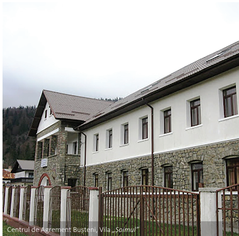
Centrul de Acordare Bușteni, Vila „Soimul”