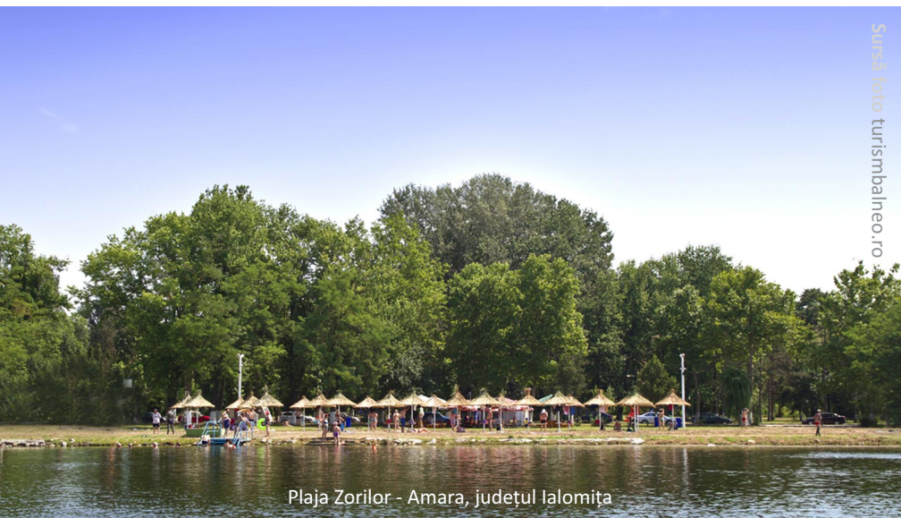
Plaja Zorilor - Amara, județul Ialomița