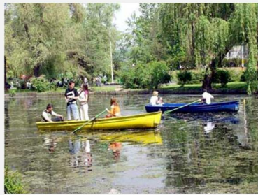
Ștrandul din Pitești