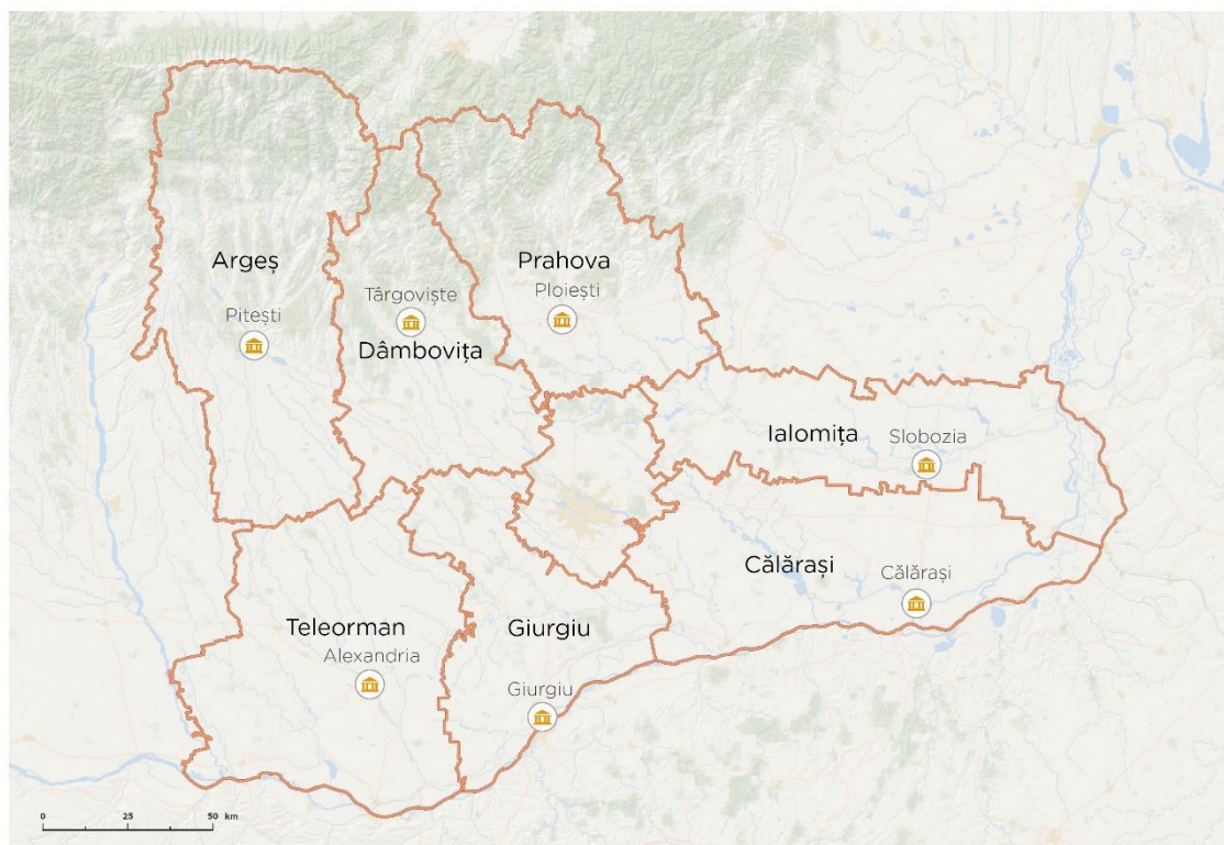
Figura 1. Localizare geografică a regiunii Sud-Muntenia.

Proiectul va acoperi regiunea Sud-Muntenia, care este formată din șapte județe: Argeș, Călărași, Dâmbovița, Giurgiu, Ialomița, Prahova și Teleorman, cu o populație de peste 3 milioane de oameni. Județele Teleorman, Giurgiu, Ialomița și Călărași sunt mărginite de Dunăre la sud.