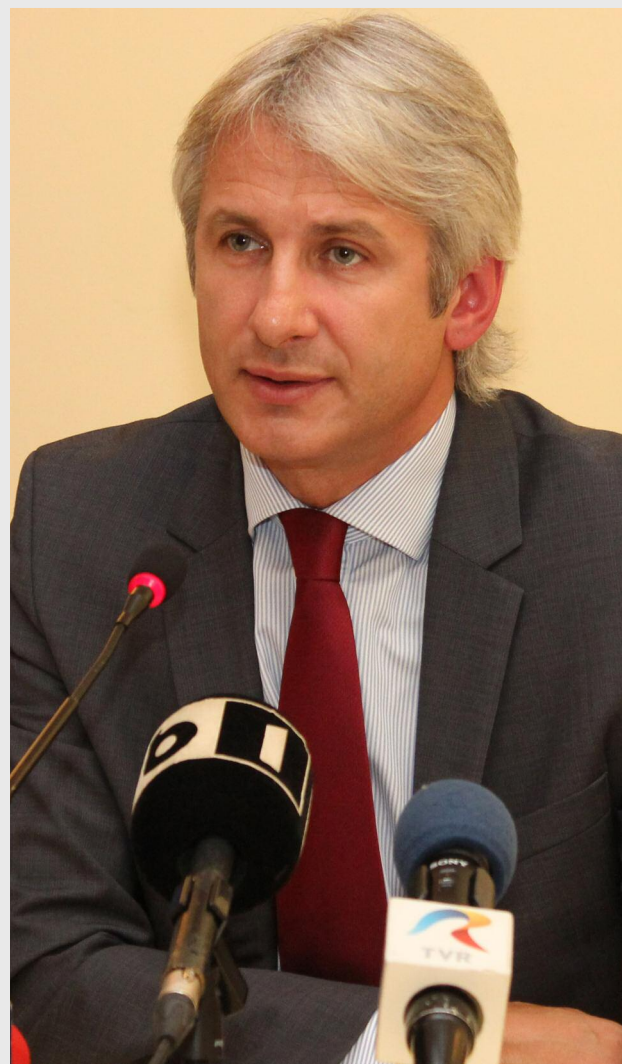
Eugen Teodorovici, ministrul fondurilor europene

Ministerul Fondurilor Europene va realiza licitația pentru alimente conform prevederilor Ordonanței de Urgență a Guvernului nr. 34/2006, privind atribuirea contractelor de achiziție publică, a contractelor de concesiune de lucrări publice și a contractelor de concesiune de servicii. Achiziția