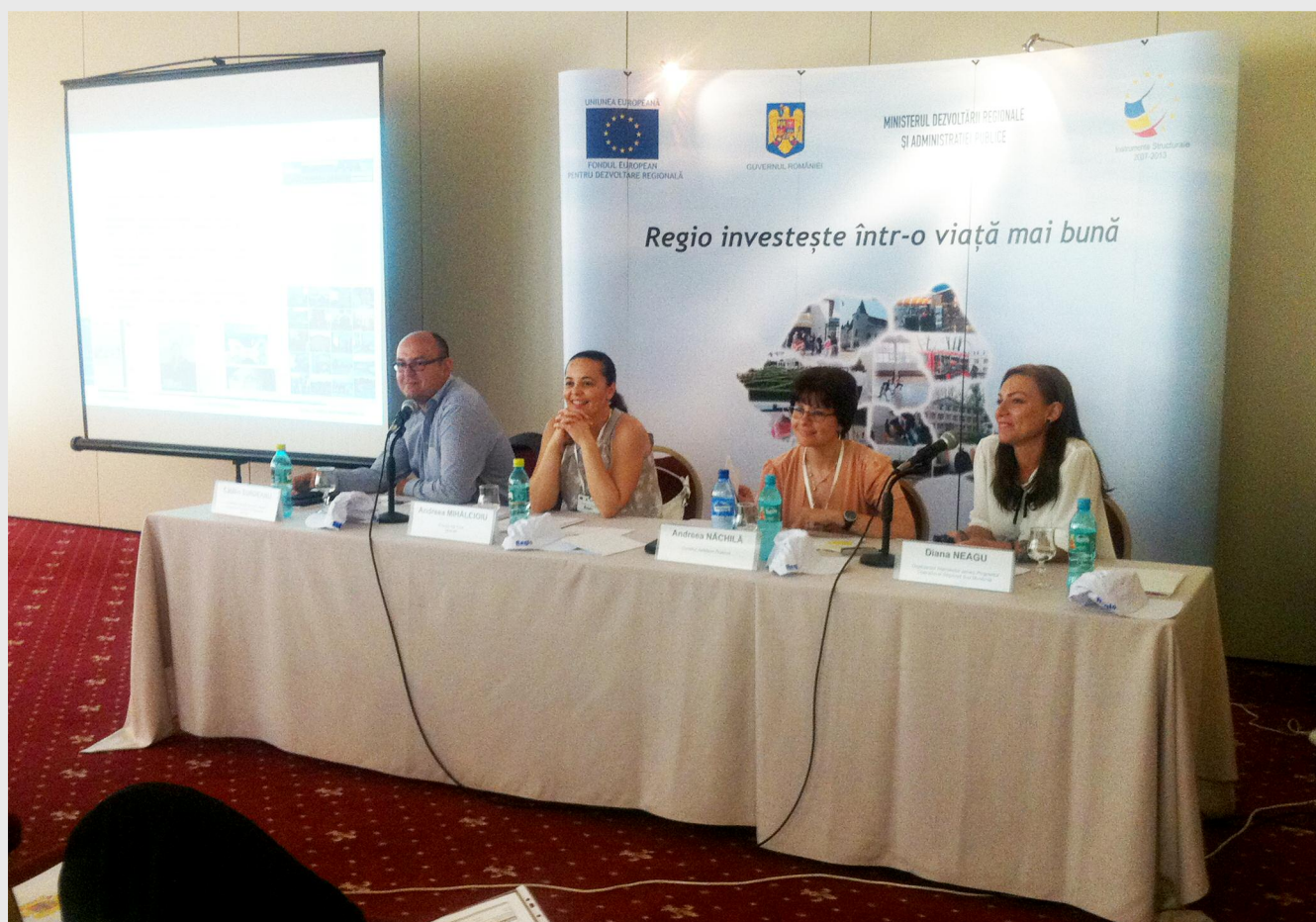
Forumul comunicatorilor Regio, ediția 2013