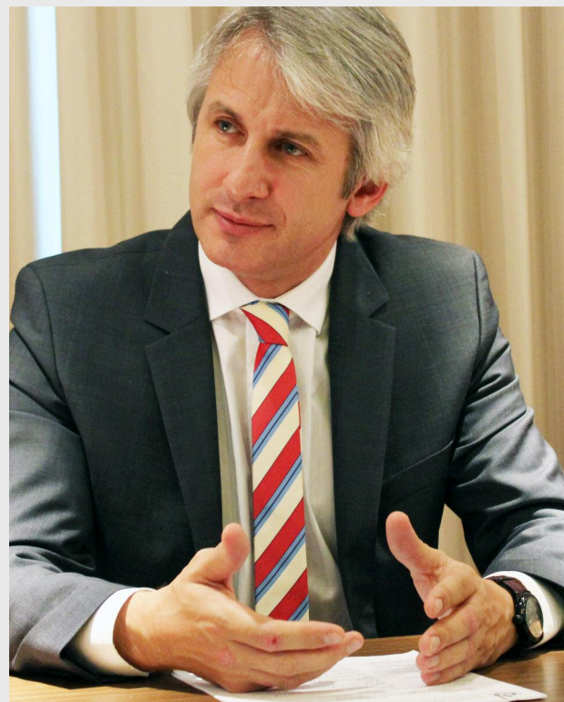
Eugen Teodorovici, ministrul fondurilor europene

„La Acordul de Parteneriat am venit cu punctul nostru de vedere la comentariile făcute de Comisie, pe fiecare direcție (...), la fel și la cel de achiziții publice, și, practic, am închis acele comentarii care au fost trimise de CE plecând de la alocările financiare pe care Comisia le-a făcut vizavi de mediu, în special având în vedere că au spus că sunt cam mici față de nevoile pe care le avem pe acest sector. Aici am arătat foarte clar că am realocat câteva sume de la sectorul de transporturi - 200 milioane de euro în plus, față de ce era alocat pe mediu -, 100 milioane de euro pe ce înseamnă apă și deșeuri și 100 de milioane de euro pe ceea ce înseamnă partea de biodiversitate”, a precizat Eugen Teodorovici. Alte aspecte ale discuției au vizat majorarea alocării financiare pentru proiectele de mediu, inclusiv biodiversitate.