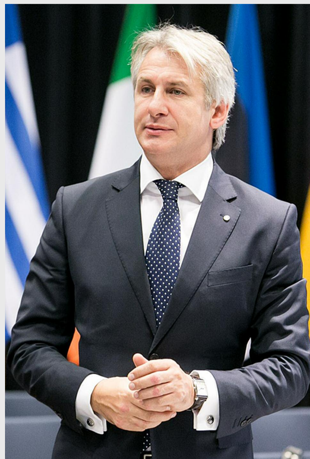
Eugen Teodorovici, ministrul fondurilor europene

Numărul maxim orientativ de posturi care vor face obiectul subvenționării, în funcție de categoria în care se încadrează beneficiarul schemei de minimis, este următorul: