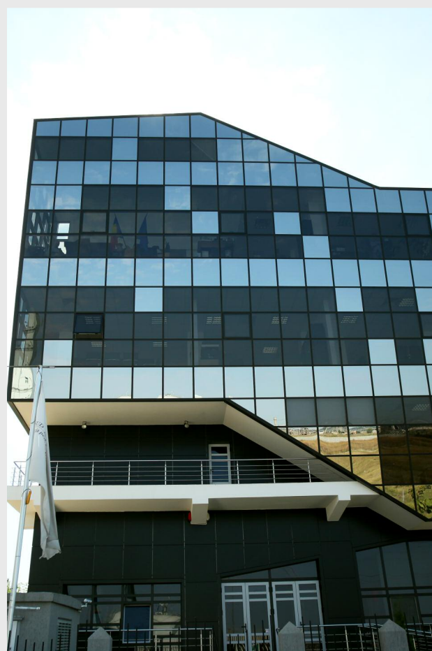
Sediul Agenției pentru Dezvoltare Regională Sud Muntenia

Scopul acestei întâlniri este de a prezenta stadiul de implementare a Programului Operațional Regional 2007 - 2013 la nivelul regiunii de dezvoltare Sud Muntenia, precum și cele mai utile canale de comunicare și promovare a rezultatelor proiectelor finanțate prin Regio. Totodată, cu această ocazie vor fi prezentate prioritățile de finanțare ale regiunii Sud Muntenia pentru perioada 2014 - 2020 - oportunitățile de finanțare din POR 2014 - 2020 și domeniile prioritare ale Planului de Dezvoltare Regională Sud Muntenia.