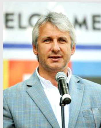
Eugen Teodorovici, ministrul fondurilor europene

Eugen Teodorovici: România poate fi la final de 2014 un model de atragere a fondurilor europene cu un sistem nou, simplificat, eficientizat