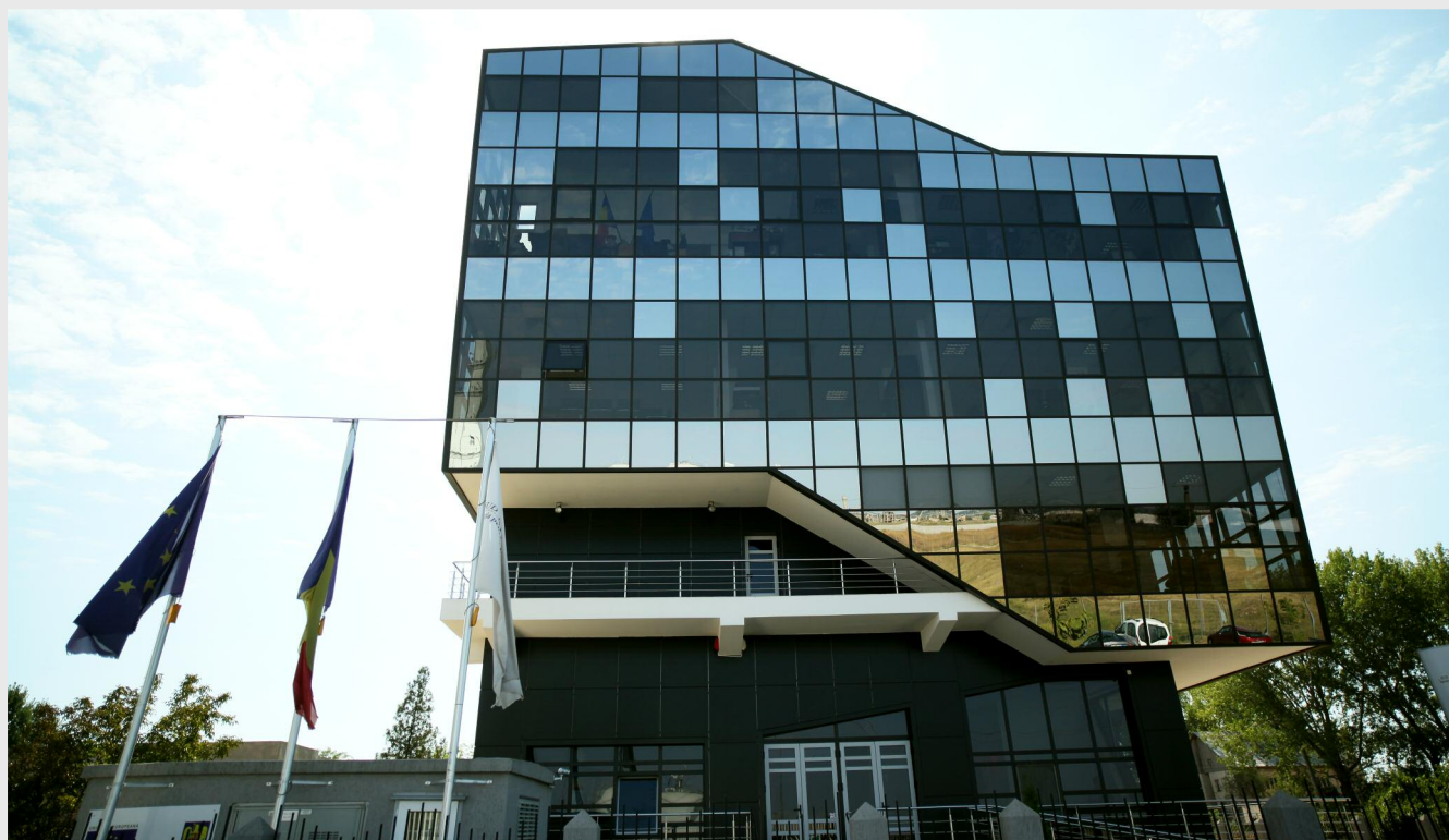
Sediul Agenției pentru Dezvoltare Regională Sud Muntenia