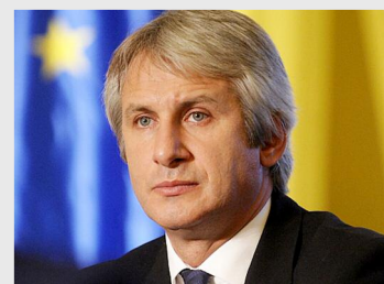
Eugen Teodorovici, ministrul fondurilor europene