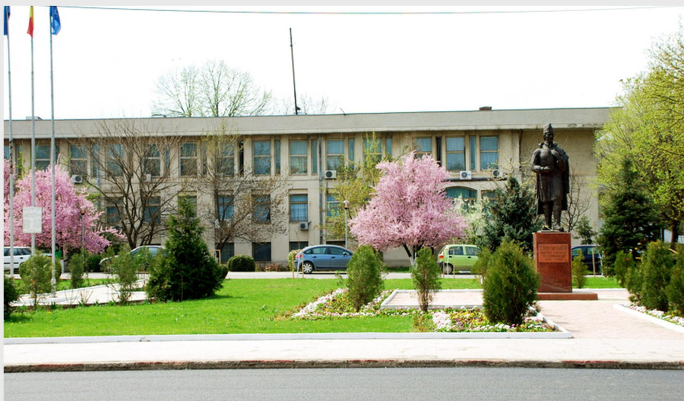
Consiliul Județean Teleorman