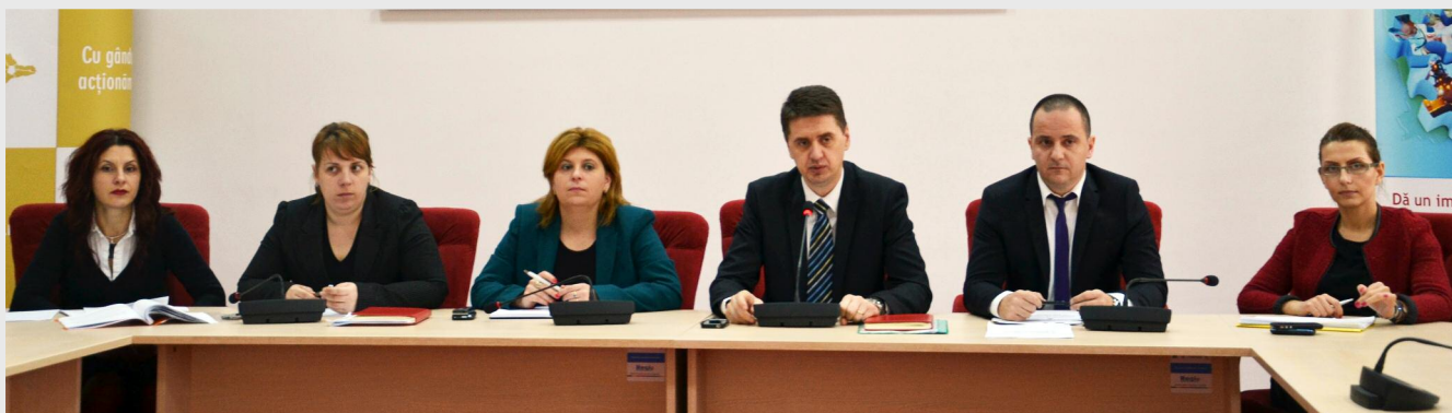
Reprezentanții ADR Sud Muntenia au informat beneficiarii de fonduri POS CCE despre procesul de implementare a proiectelor