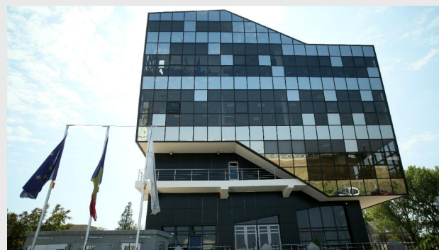
Sediul ADR Sud Muntenia

L.M.: În cea mai mare parte, proiectele finanțate au fost absolut necesare și au contribuit la creșterea calității vieții în comunitățile unde ele s-au realizat. Cu toate acestea, aspectul impactului economico-social trebuie să constituie una din lecțiile pe care trebuie să le aplicăm în perioada ur-