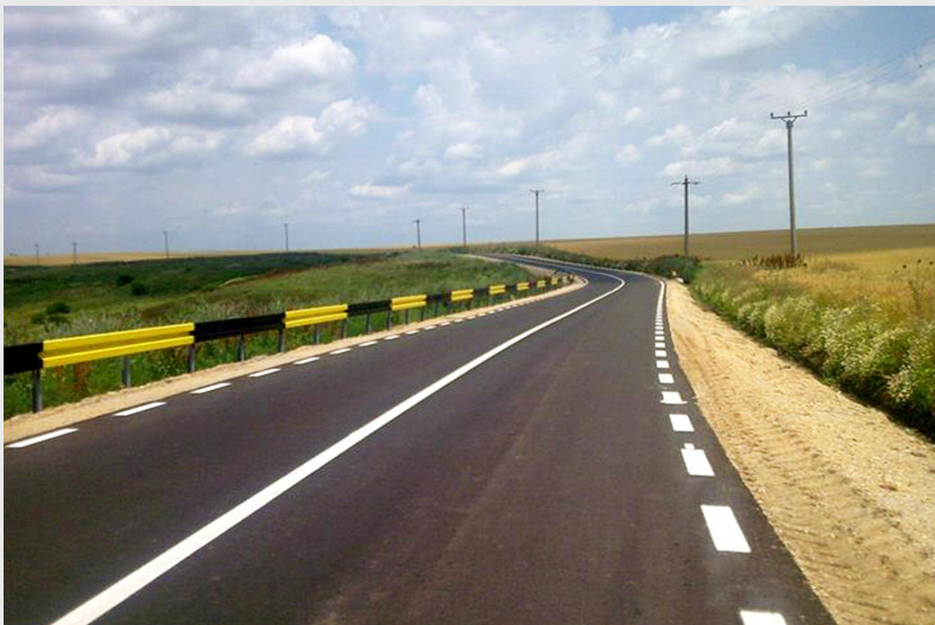
Modernizarea DJ 506 a dus la realizarea legăturilor rapide cu drumurile naționale și coridoarele de transport europene